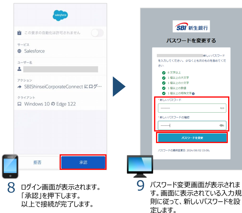
8 ログイン画面が表示されます。「承認」を押下します。以上で接続が完了します。