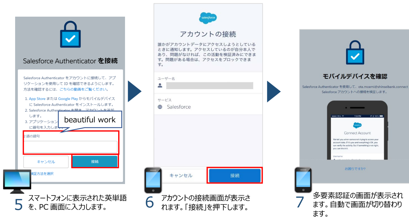
5 スマートフォンに表示された英単語を、PC 画面に入力します。